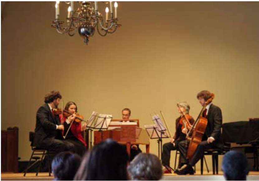
Van Swieten Society